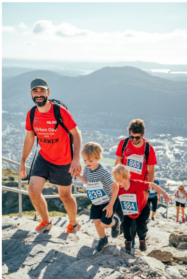
Familie og venner på tur Oppstemten opp 2022